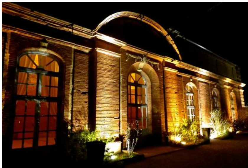
L'Orangerie de Rochemontès